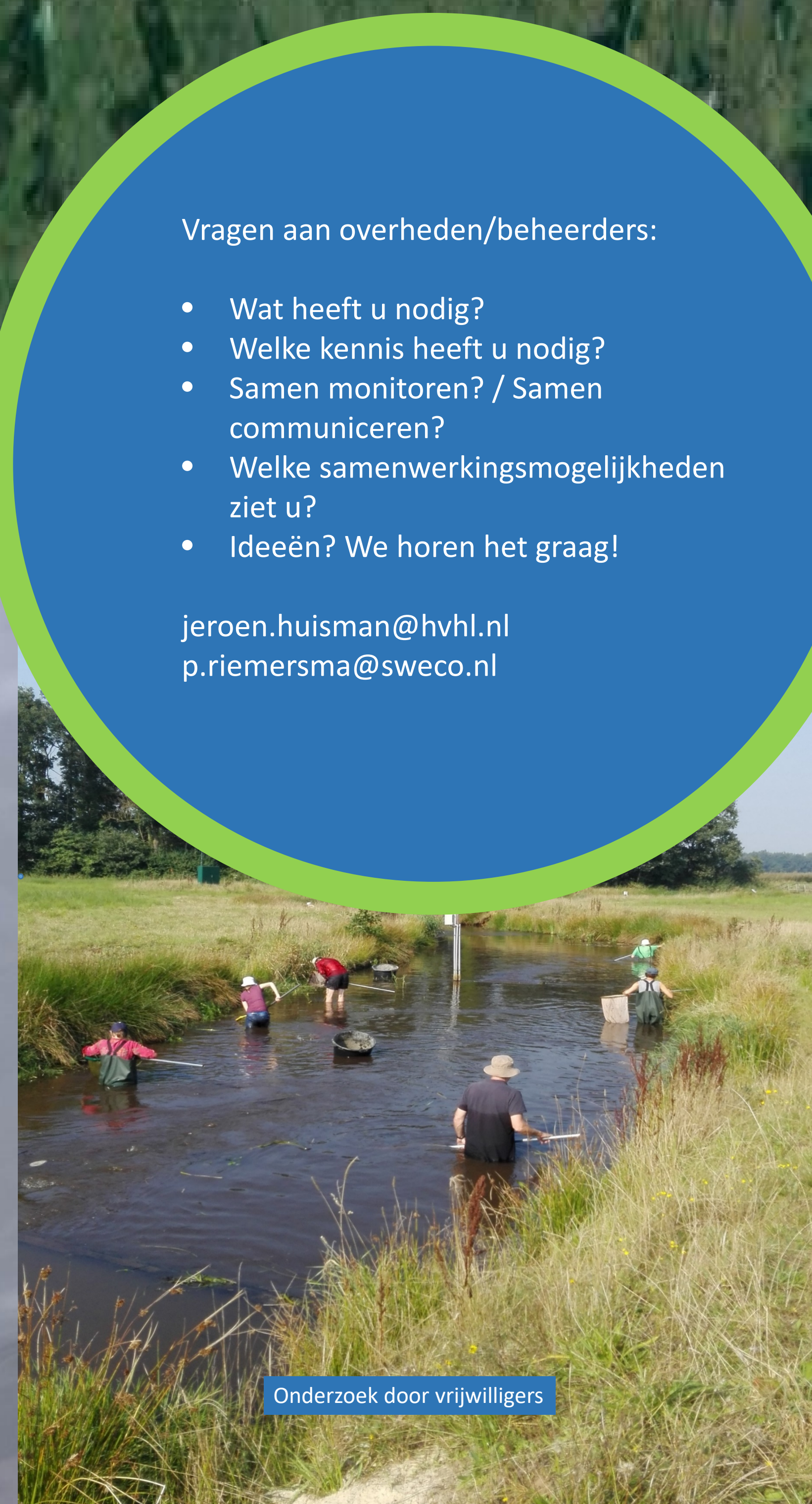
Onderzoek door vrijwilligers